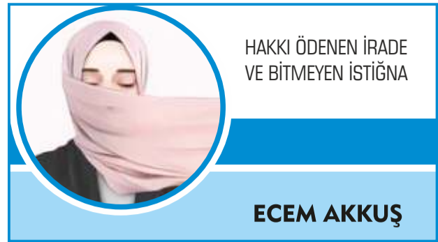
HAKKI ÖDENEN İRADE VE BİTMİYEN İSTİĞNA